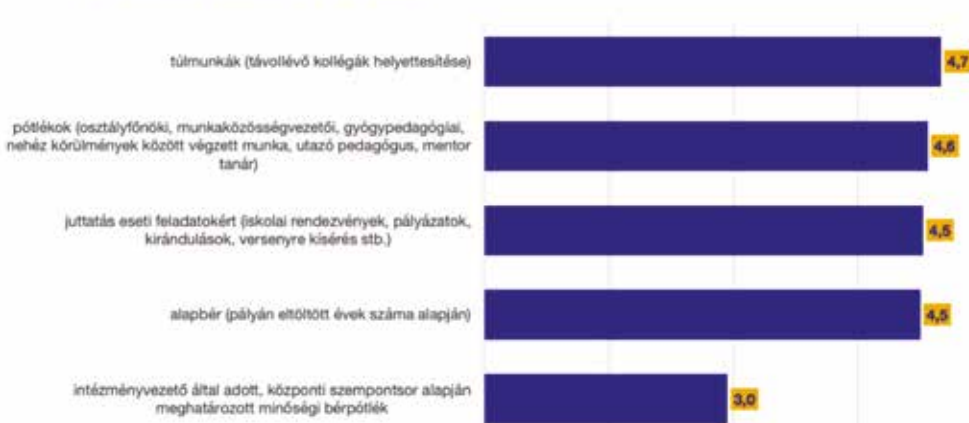
6. ábra. Ön egyetért vagy nem ért egyet azzal, hogy ötelemű bérrendszer legyen a köznevelésben, amely a következő elemeket tartalmazza?

galmazni: elégtelen (1,3 pont). Ugyancsak elégtelennel értékeli azt a javaslatot, amely szerint nem veszik figyelembe a pályán eltöltött időt a bérszámítás során (1,5 pont).